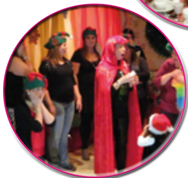
Spectacle de Noël