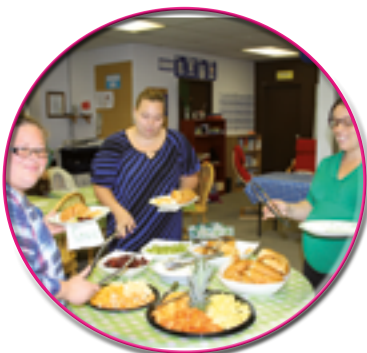
Préparation du brunch