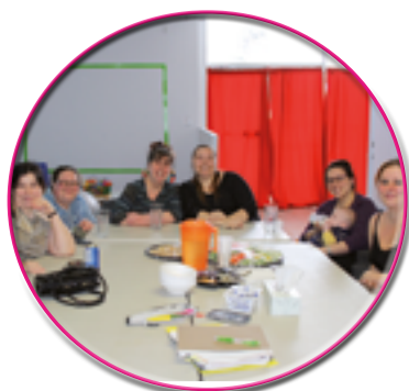
Le CPP en action