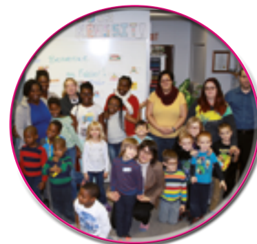
Le groupe de finissants