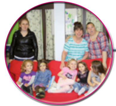
Amitiés au Fablier