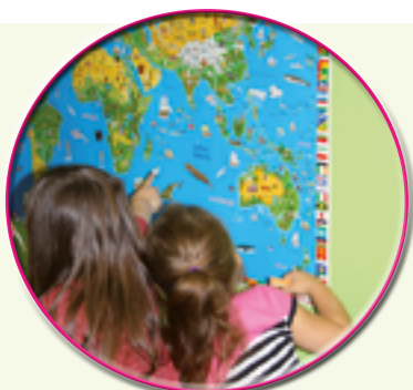
Observation de la carte du monde