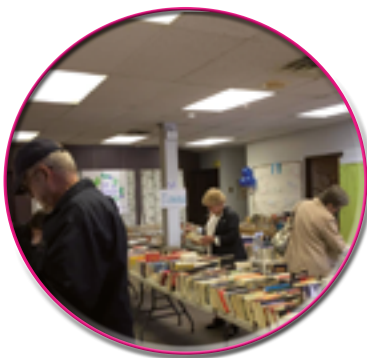
Ventes de livres

Cette année, la campagne de financement a permis de recueillir une somme de 47 312$, grâce à la générosité de partenaires de la communauté et de la population. Nous tenons d'ailleurs à remercier chacun d'entre eux pour leur confiance et leur fidélité à l'égard du Fablier! Un remerciement particulier à la Fondation Secours La Feuilleraie pour son précieux apport! Par ailleurs, pour une troisième édition, les parents membres du Fablier ont travaillé très fort pour l'organisation de la vente de livres et de jeux de société qui s'est tenue les 2 et 3 juin dernier et qui a permis d'amasser plus de 2 000$.