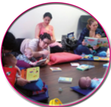
Éveil à la lecture