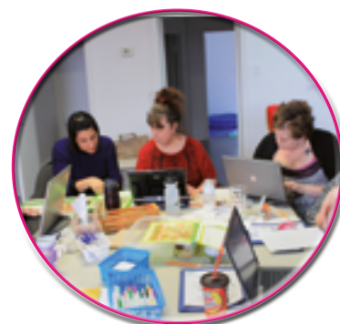
Rédaction à l'ordinateur