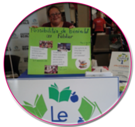
Salon de bénévolat jeunesse