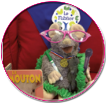
Semaine de l'alpha pop

LA MOBILISATION revêt une dimension importante au Fablier. Elle vise l'amélioration des conditions de vie des familles afin de les aider à reprendre du pouvoir sur leur vie et la sensibilisation de différents milieux à la prévention de la pauvreté et de l'analphabétisme. Ces actions peuvent prendre diverses formes : éducation populaire, manifestation, sensibilisation, représentations, actions de visibilité.