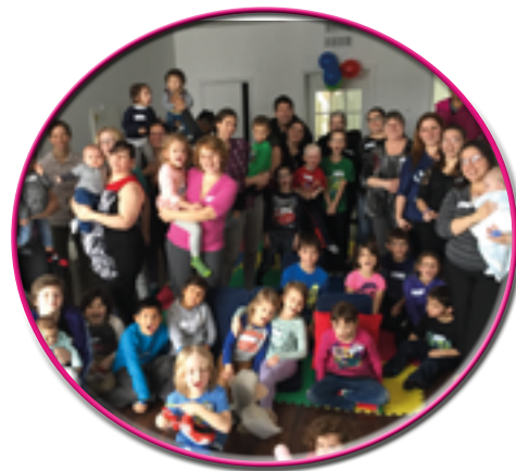
Journée de l'alphabétisation familiale