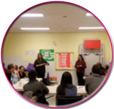
Atelier au CPE