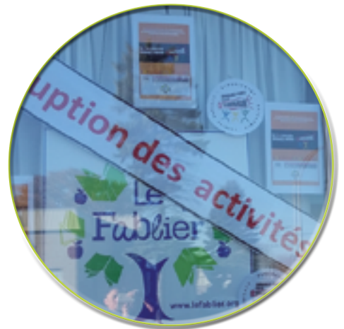
Action : Engagez-vous pour le communautaire!