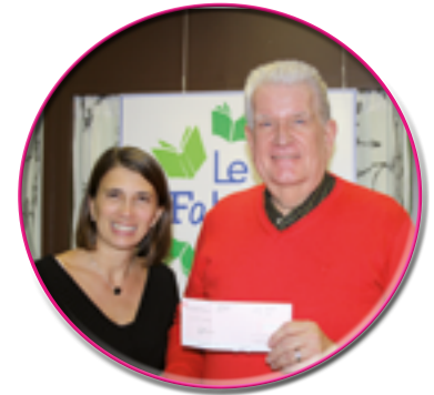
Un précieux partenaire