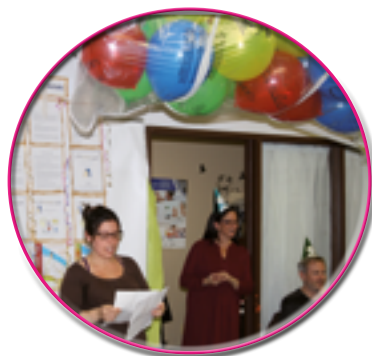
Présentation des bons coups de l'année

L'AGA est un moment privilégié pour faire le point avec les membres sur l'année qui s'est terminée et pour déterminer ensemble les priorités de travail de la prochaine année. Il s'agit d'un événement important de la vie démocratique de l'organisme qui offre la possibilité aux membres d'exercer leur pouvoir et de prendre la parole sur des choses qui leur tiennent à cœur.