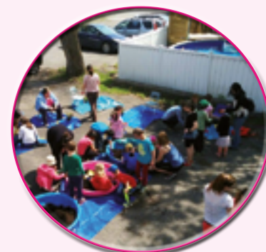
Jardinage en famille