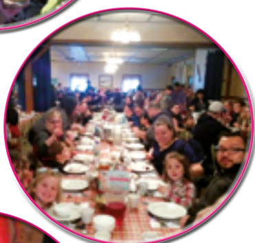
Cabane à sucre

Activités sociales qui sont l'occasion de réunir tous les membres des familles afin de partager des moments festifs. Ces moments permettent aux membres de s'impliquer dans différents comités d'organisation.