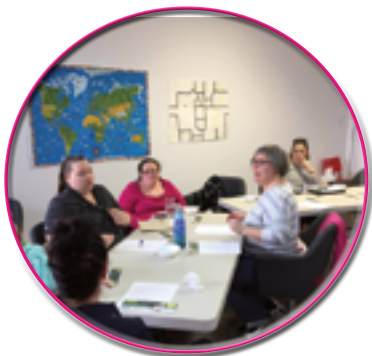
Atelier animé par l'ACEF