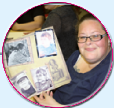
Journal de famille