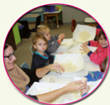
Activité de groupe