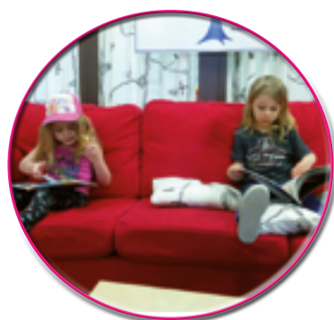
Le goût de la lecture