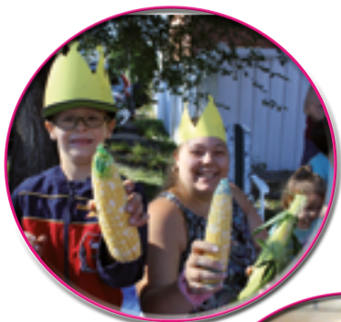
La reine et le roi