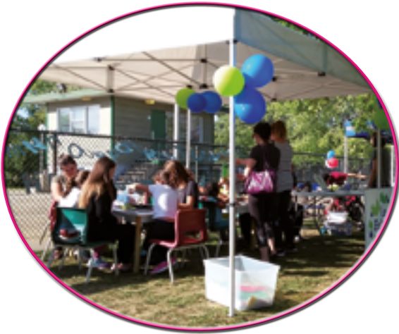
Fête de quartier

La concertation est pour nous un moyen privilégié de faire connaître les réalités des familles et de promouvoir l'importance de la prévention de l'analphabétisme. Le Fablier est également préoccupé par les enjeux touchant les groupes communautaires autonomes et s'implique donc dans diverses actions en ce sens.