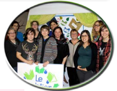
Membres du C.A. et jeunes bénévoles