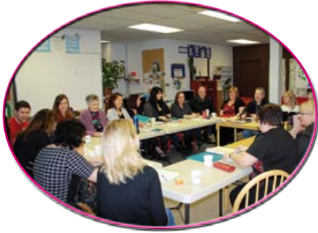
Table Petite Enfance

LA CONCERTATION est pour nous un moyen privilégié de faire connaître les réalités des familles et de promouvoir l'importance de la prévention de l'analphabétisme. Le Fablier est également préoccupé par les enjeux touchant les groupes communautaires autonomes et s'implique donc dans diverses actions en ce sens.