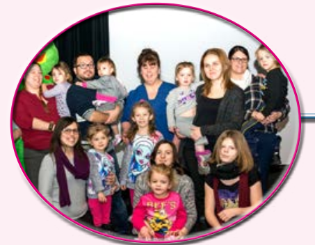
Concours de comptine