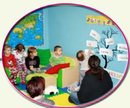
Reconnaître son prénom