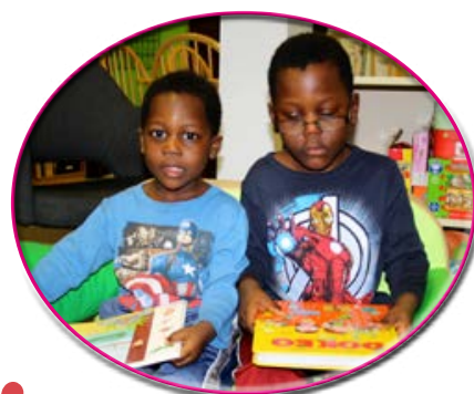
Prêt de livres pour enfants