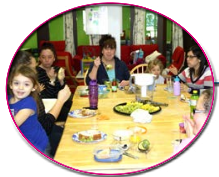
Diner en familles