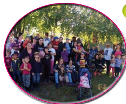
Sortie aux pommes