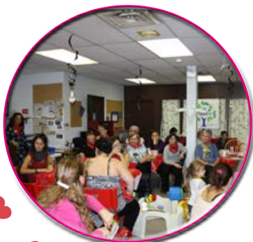
AGA du Fablier

L'AGA est un moment privilégié pour faire le point avec les membres sur l'année qui s'est terminée et pour déterminer ensemble les priorités de travail de la prochaine année. Il s'agit d'un événement important de la vie démocratique de l'organisme qui offre la possibilité aux membres d'exercer leur pouvoir et de prendre la parole sur des choses qui leur tiennent à cœur.