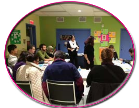
Atelier CPE Pierrot La Lune