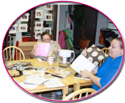
Échange de recettes