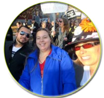
Mobilisation marche funèbre