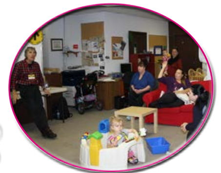
Atelier sur les élections