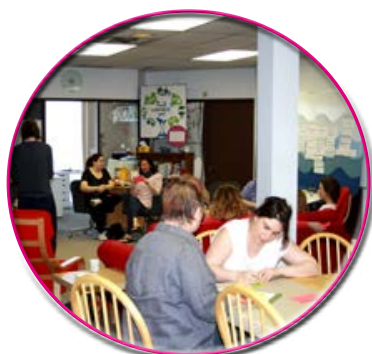
Journée de réflexion